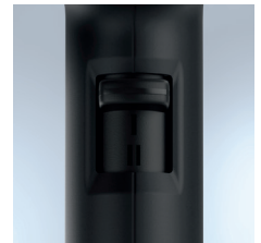
2 Stufen Gebläse